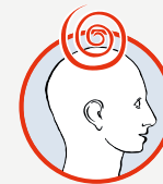
Schwindel mit Gangunsicherheit