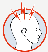
Sehr starker Kopfschmerz